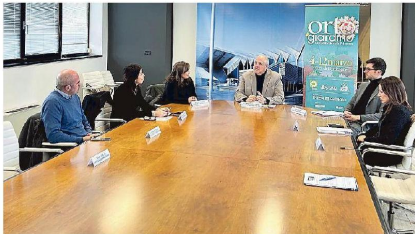
Gli intervenuti in Fiera a Pordenone alla presentazione della 42ª edizione di Ortogiardino

Tra gli appuntamenti più attesi torna il Festival dei giardini con il tema "Il giardino segreto. Chi cerca trova": dieci i progetti finalisti che saranno dislocati tra i padiglioni 4 e 9 per essere ammirati e votati da addetti ai lavori e pubblico. Idee innovative, interpretazione del tema, conoscenza delle piante e capacità tecnica nella realizzazione dell'opera saran-