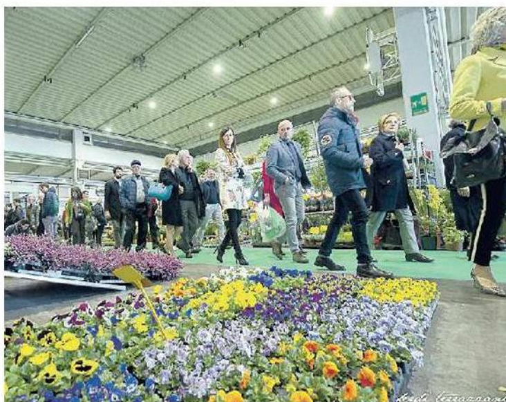
SI COMINCIA IL 4 MARZO Appuntamento con Ortogiardino

IL TEMA DELL'ESPOSIZIONE È "IL GIARDINO SEGRETO CHI CERCA